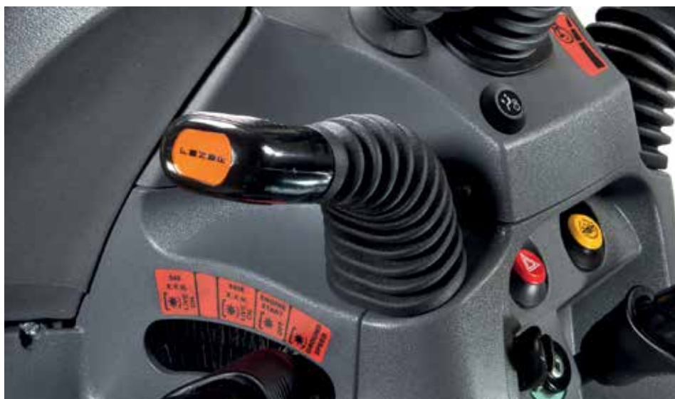
VELOCITÀ DI AVANZAMENTO IN KM/H DEL CAMBIO MECCANICO 12+12

Per quanto riguarda la frenatura i Solaris sono dotati di un sistema potente ed efficace a dischi in bagno d'olio per una completa sicurezza operativa.