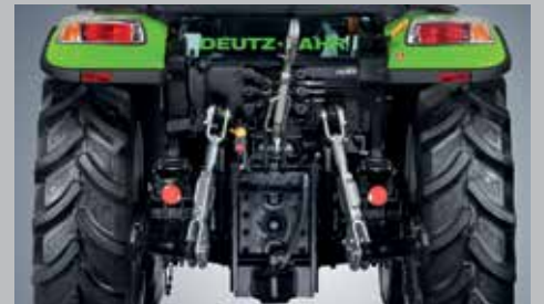
Pompa idraulica da 50 l/min, fino a tre distributori, sollevatore posteriore da 3.500 kg, PTO 540/540ECO/1000.