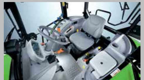
Comoda cabina. Visibilità a 360 gradi, comandi estremamente ergonomici e possibilità di scelta tra due diversi tipi di tetto.