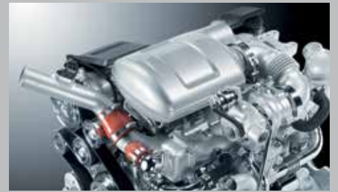
Motori FARMotion con iniezione elettronica common-rail a 2.000 bar, ricircolo gas di scarico e sistema DOC.