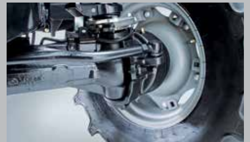
Doppia trazione attivata a pulsante e bloccaggio del differenziale al 100%, freni sulle quattro ruote e angolo di sterzata di 55 gradi.