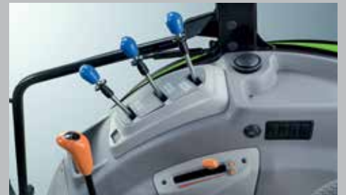
Trasmissione meccanica fino a 30 + 15 marce, 40 km/h a 1,870 giri/min.