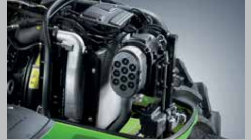
Radiatore compatto con ventola Visco e filtro aria PowerCore per la massima efficienza del motore.