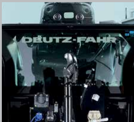
Doppio vetro posteriore (7250 TTV)