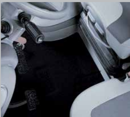
Tappetino WARRIOR nero (7250 TTV/9340 TTV)