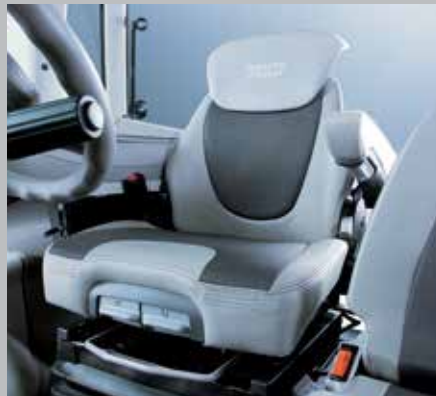
Comodo sedile WARRIOR (7250 TTV/9340 TTV)