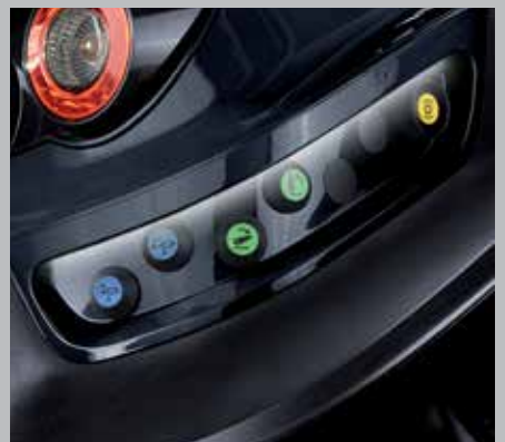
Illuminazione a LED per i comandi esterni (7250 TTV)