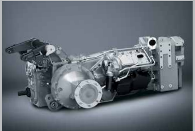
Efficienza ottimale: Trasmissione TTV a variazione continua con velocità massima di 60 km/h e un regime economico motore.