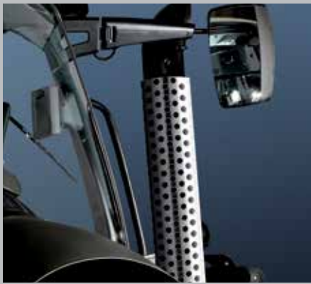
Tubo di scarico con rivestimento in acciaio inossidabile (7250 TTV/9340 TTV)