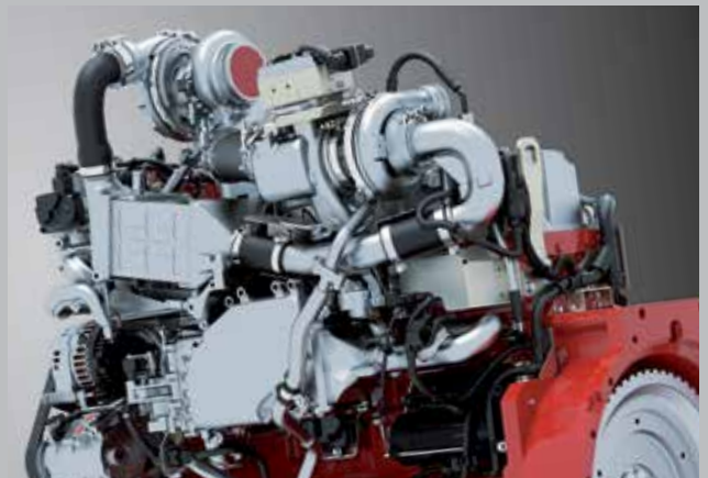
Motore Deutz da 246 CV (181 kW): risposta immediata con elevata coppia di spunto e considerevole riserva di coppia con risparmio nei consumi di carburante e AdBlue fino al 5%.