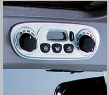
Climatizzatore automatico (7250 TTV/9340 TTV)