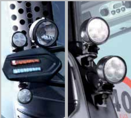
Luci a LED WARRIOR su parte anteriore/posteriore cabina (7250 TTV/9340 TTV), opzionale