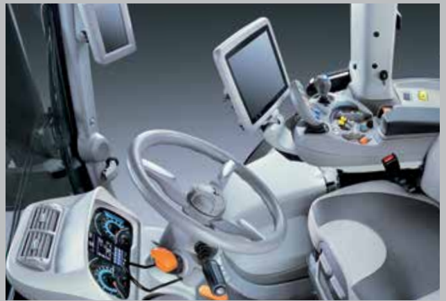
Cabina MaxiVision 2 con il bracciolo ridisegnato e l'iMonitor da 8" o 12". Massimo comfort per una capacità di guida ottimale.

Il nuovo 7250 TTV WARRIOR è il modello speciale in edizione limitata, destinato alle applicazioni più gravose in campo e su strada. La sua missione è la massima produttività – con una finitura nera brillante che riflette i brillanti risultati operativi. Questo trattore dal forte impatto visivo eroga 246 CV (181 kW) e presenta una serie di caratteristiche tipiche del marchio tedesco: Qualità massima, ingegneria di precisione e affidabilità sono di serie. Come lo è la tecnologia d'avanguardia capace di ridurre i costi pur salvaguardando l'ambiente. L'innovativa e intelligente tecnologia del trattore permette al 7250 TTV WARRIOR di mettere in risalto la vostra professionalità – mentre vi gusterete il comfort straordinario della cabina MaxiVision 2. Comandi intuitivi, sistemi per l'agricoltura di precisione, concetti innovativi per gli assali e l'impianto frenante, e punti di aggancio per le combinazioni di attrezzatura più pesanti completano un pacchetto ad edizione limitata veramente speciale. Independentemente da quanto dura sarà la stagione, il 7250 TTV WARRIOR vi permetterà ottenere di ancora di più.