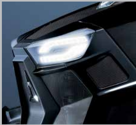
Luci anteriori a LED WARRIOR e finitura nera lucida (7250 TTV/9340 TTV)