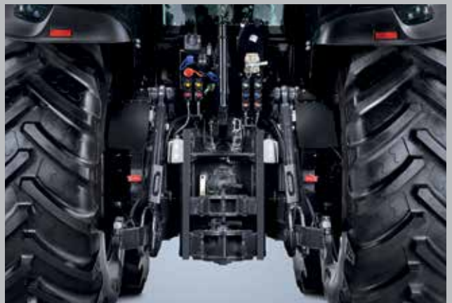
Impianto idraulico con portata fino a 160 l/min, capacità di sollevamento fino a 10000 kg e quattro velocità della PTO. Tutto è possibile.