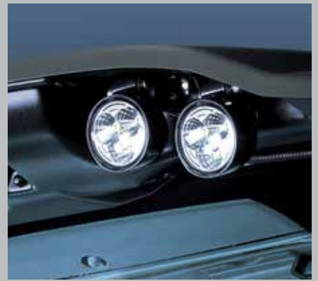
Luci a LED WARRIOR sul tetto (7250 TTV/9340 TTV) di serie